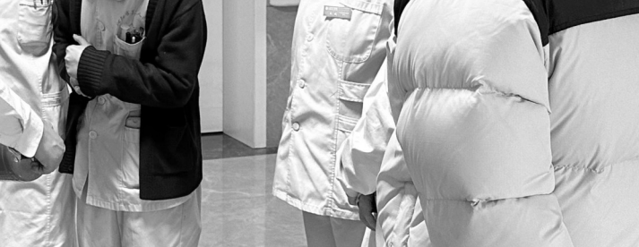
二郎镇卫生院中医馆为辖区群众提供中医药适宜技术服务