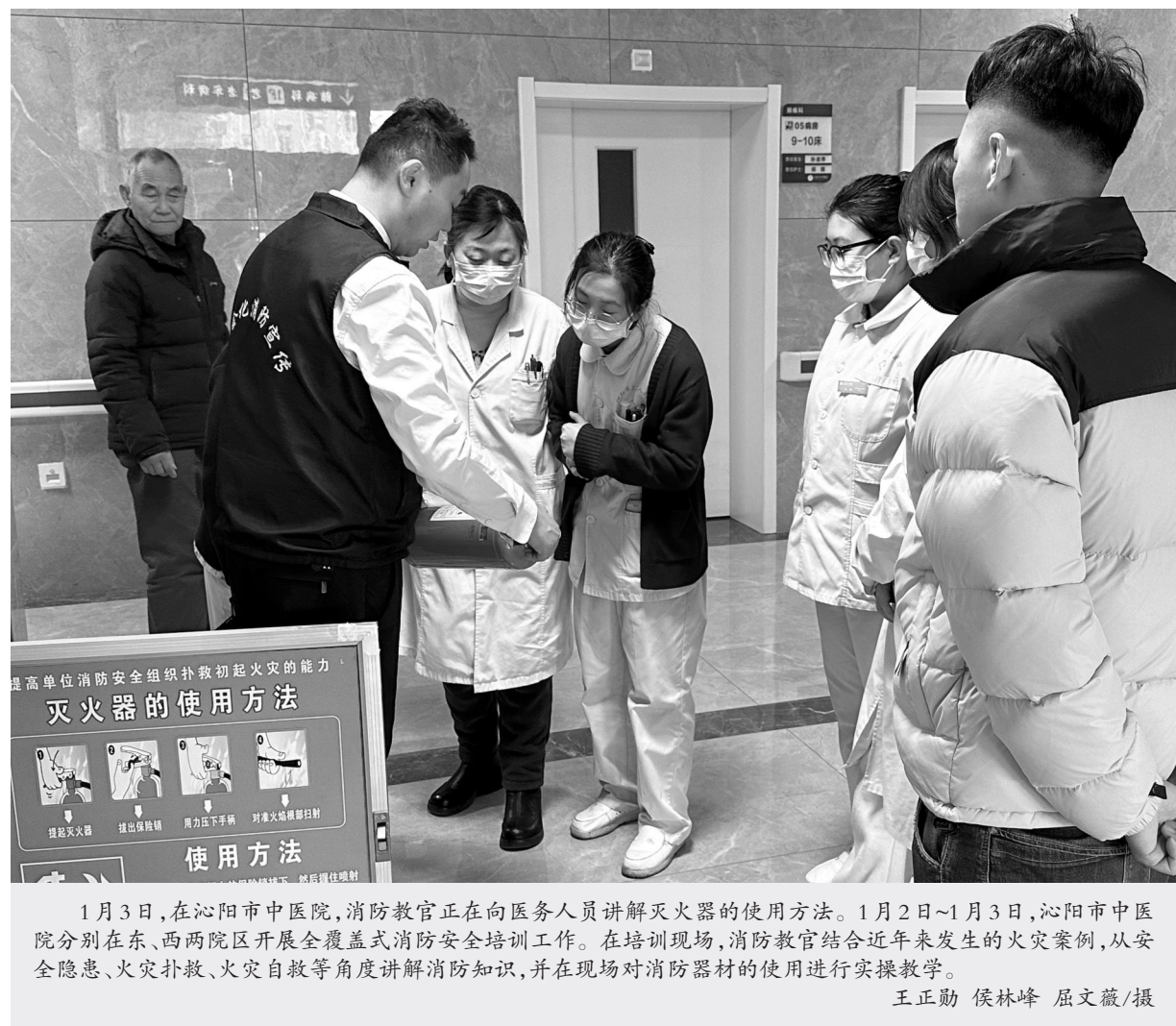
1月3日,在沁阳市中医院,消防教官正在向医务人员讲解灭火器的使用方法。1月2日-1月3日,沁阳市中医院分别在东、西两院区开展全覆盖式消防安全培训工作。在培训现场,消防教官结合近年来发生的火灾案例,从安全隐患、火灾扑救、火灾自救等角度讲解消防知识,并在现场对消防器材的使用进行实操教学。

登封市人民中医院工会驿站坚守医者仁心,开展“五进”活动,多次组织专科医生为户外劳动者开展义诊活动。针对户外劳动者生活作息不规律、长期提重物、工作强度大等特点,医务人员从中医治未病的角度给予合理化建议和职业健康指导,并引导他们树立个人防护意识,培养良好的健康生活习惯。同时,为他们免费提供耳穴压豆、核桃明目灸、正骨按摩等中医特色项目服务,一位环卫工人说:“太舒服了、太神奇啦!”义诊活动将健康关爱送到户外劳动者“家门口”,为他们撑起一把健康“保护伞”,进一步提升群众的获得感、幸福感、安全感。