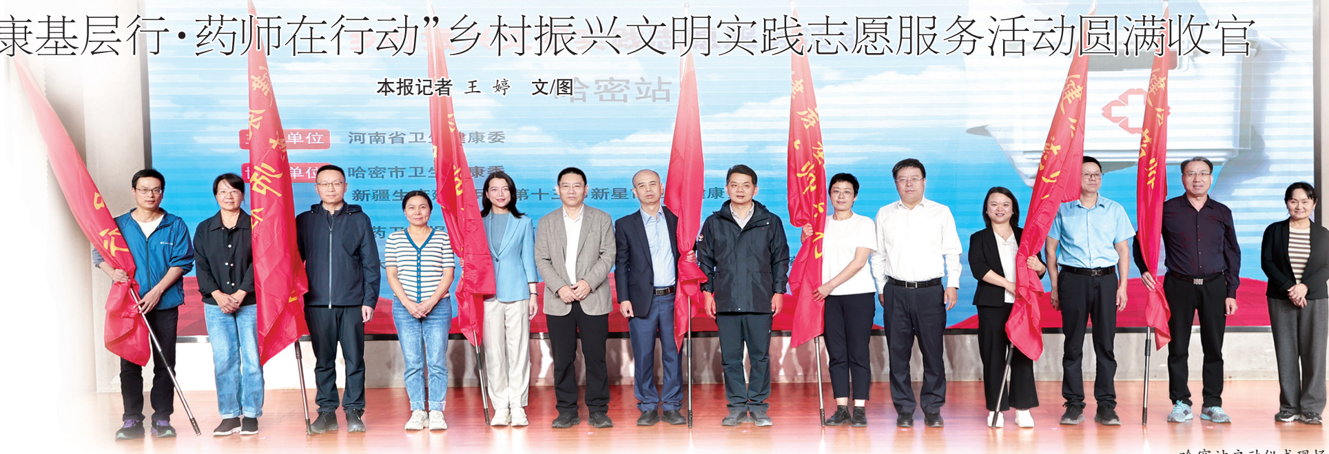
哈密站启动仪式现场

12月12日~13日，“健康基层行·药师在行动”乡村振兴文明实践志愿服务系列活动走进上蔡县，也标志着2024年“健康基层行·药师在行动”乡村振兴文明实践志愿服务系列活动画上了圆满的“句号”。今年，“健康基层行·药师在行动”乡村振兴文明实践志愿服务系列活动共走进八地，分别是舞阳县、洛宁县、登封市、南乐县、柘城县、灵宝市、上蔡县以及新疆维吾尔自治区哈密市（以下简称哈密市）。