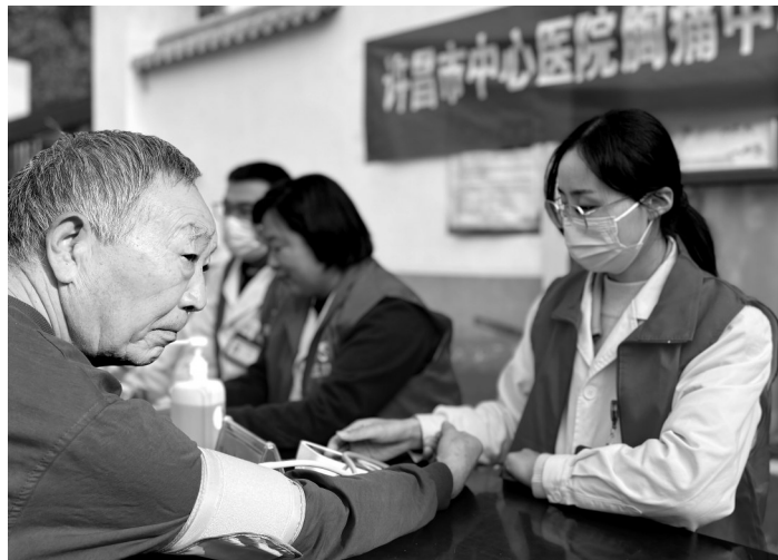
↑11月20日,在许昌市魏都区寿昌社区,医务人员为群众量血压。当天,许昌市中心医院组织医务人员走进魏都区寿昌社区,开展中国心梗救治日义诊和知识宣教活动,让更多的人了解出现胸痛后的紧急救治知识。

2024年11月20日是第11个中国心梗救治日,宣传主题为“心梗拨打120,胸痛中心快救命”。河南多地开展了形式多样的宣传活动,以进一步提高公众对预防与治疗心梗重要性的认识,广泛推广心梗规范化救治流程,将“牢记两个120,心梗时刻能救命”的急救理念深深植根于民众心中。