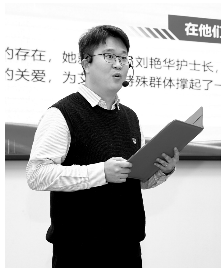
↑11月19日,在“焦谈有理 医心向党”党的创新理论宣讲大赛现场,选手进行演讲比赛。当天,焦作市卫生健康委组织了本次比赛,来自焦作市直医疗机构的11位选手进行了精彩的演讲。