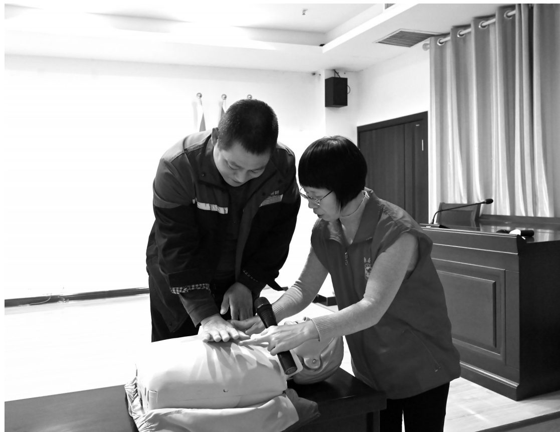
↑11月20日,在万洋集团,志愿者指导职工学习心肺复苏技能。当天,济源市第二人民医院组织志愿者走进万洋集团,现场为职工讲解胸痛的相关知识,普及急性心梗的规范化救治流程,进一步提高公众对预防与治疗心梗重要性的认识。